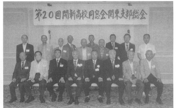
第20回開新高校同窓会関東支部総会

さて、関西支部の活動状況ですが、前述しました、関西地区で開催される、各種大会への応援や関西熊本県人会連絡協議会加盟の各種団体（高校の同窓会を中心に五十六団体）との交流会等に積極的に参加しております。年一回開催の総会は、毎年四月の第一日曜と決めておりましたが、新型コロナウイルス感